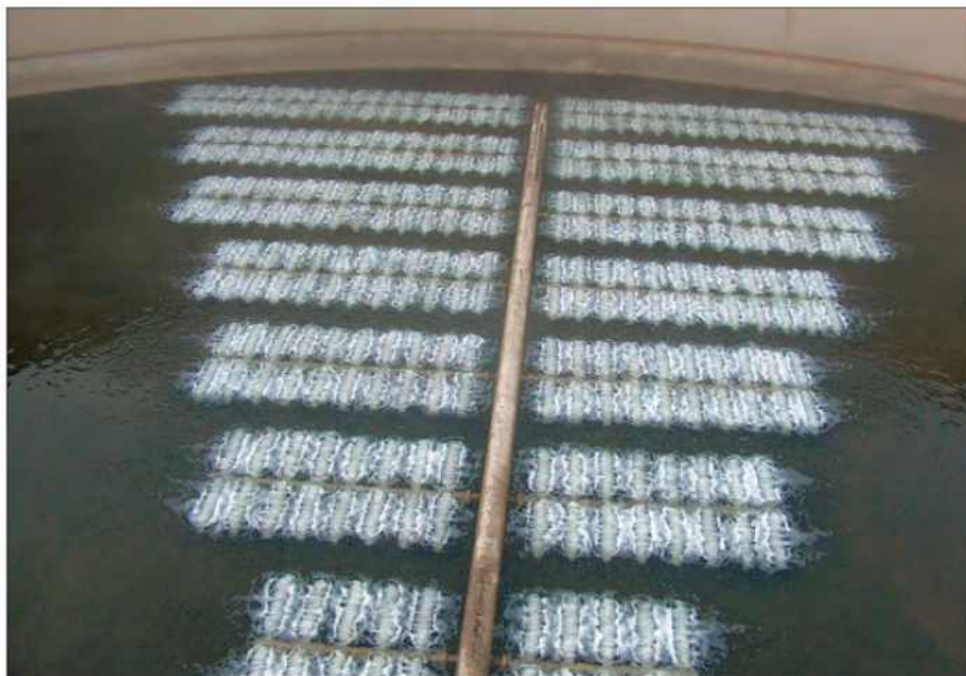
Membránové provzdušňovače od firmy OTT zajišťují jemnobublinnou aeraci.