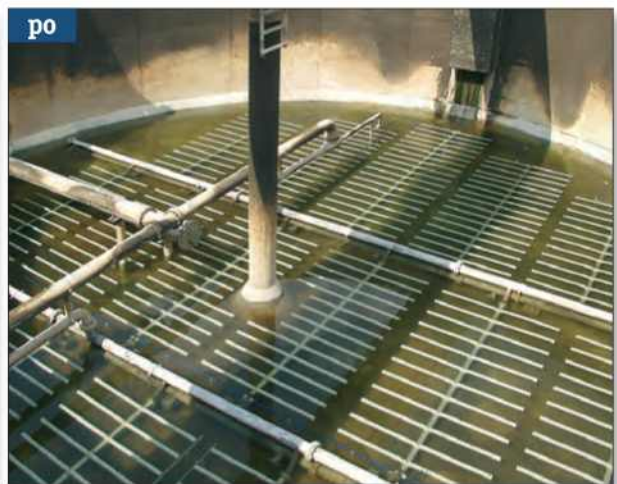
Rychlá, nákladově výhodná přestavba jednoduchou integrací.