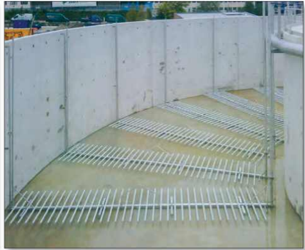
Vydvíhovatelné systémy umožňují údržbu za provozu.